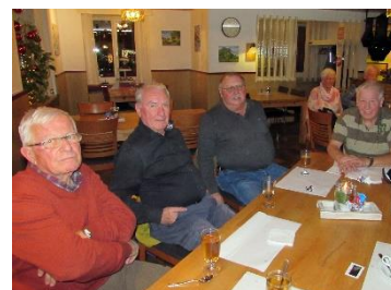
Und zum Schluss - e Kaffi mit Schuss

Es war eine schöne kurze Wanderung, Trocken und Trüb, aber man sah bis zur Hohen Winde, wo Schnee lag. Ich hoffe das die Wanderung vom 19. Januar 2022 stattfinden kann und ich eine tolle Wanderschar begrüßen kann. Bericht Wanderleiter Othmar